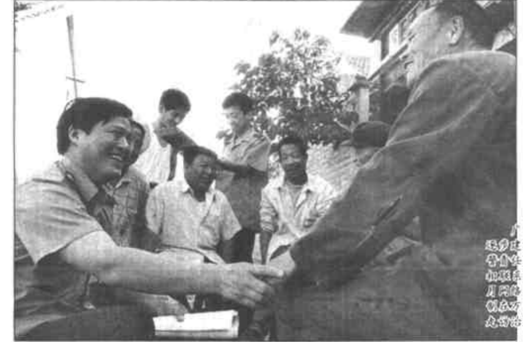
垦利县司法局组织普法宣传，提高群众法律意识。

被省政府授予“依法行政先进单位”的垦利县人民政府，严格依法行政，做到研究工作学法，制定决策用法，处理政务合法。深受群众称赞。 为了强化政府法制，严格依法行政，该县聘请了常年法律顾问，在县政府设立了专门顾问室，重大决策请律师参加。为贯彻实施《行政诉讼法》、《行政复议法》等有关法律法规，对政府出台的规范性文件进行清理。“三五”普法期间，共清理规范性文件277件，修改14件，废止5件。清理行政执法主体56个，认定有行政处罚权的39个。对全县774名行政执法人员进行了审批登记，并进行了专门培训。县政府每年都与全县各乡政府和56个行政执法部门签订学法目标责任书。 学法重在用法，垦利县注重依法管好市场、管好企业、管好城建，依法治理农村。对全县的7972个个体工商户、165家私营企业抓好普法教育，使经商人员和外来务工人员自觉遵纪守法。对企业，结合加强企业管理，深化企业制度改革，走依法治厂的路子。在城市规划建设管理上，严格按照《建筑法》的要求，完善建筑工程施工许可证制度，规范建筑工程承包程序，制订了县城建设发展的《总体规划》。在农村，结合开展“三五”普法，深入抓好依法治村。在全县332个行政村实施“十万千万”工程，即每年在全县树立表彰10个普法红旗单位，100个遵纪守法光荣户；乡镇树立表彰1000个普法先进单位(村)和遵纪守法户；村级普法红旗单位40个，遵纪守法光荣户400户。乡镇表彰的普法先进单位(村)4000个。村级评选出的遵纪守法光荣户40000户。依法治理的延伸，使广大人民群众自觉地依法规范个人的行为，争当遵纪守法好公民。 (王文元)