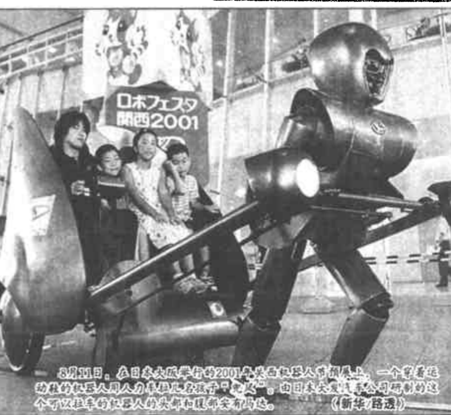
8月10日,在日本自卫队举行的2001年度军事演习开幕式上,一个身穿迷彩服的自卫队员向人们展示威力巨大的“暴龙”导弹。

当地土岁的老人们讲,传说当年成吉思汗的13匹金驹在此神秘失踪化作土堡,也有的说当年胡人公主故于此,胡人悲痛欲绝立大墓祭祀;但一位年长的蒙古族老人说,古代博河两岸是游牧民族生产生活及宗教活动的中心,因此这或许是庙宇的遗址。